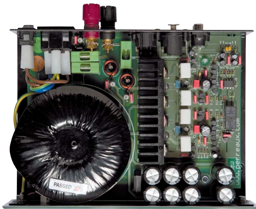
Perreaux a installé un circuit de puissance en classe AB dans son ampli SX60m.